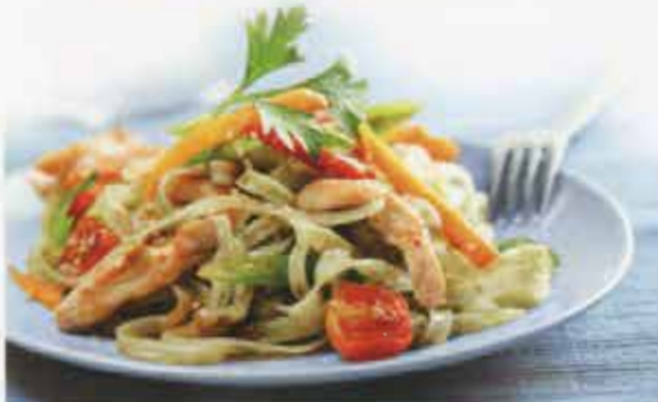
Alle Preise inkl. Mehrwertsteuer und Bedienung.