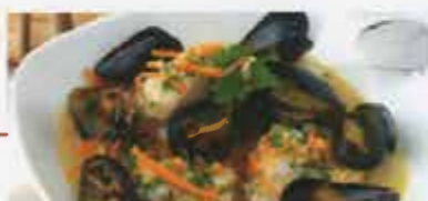
1250 Frische Muscheln! Nur nach Saison.